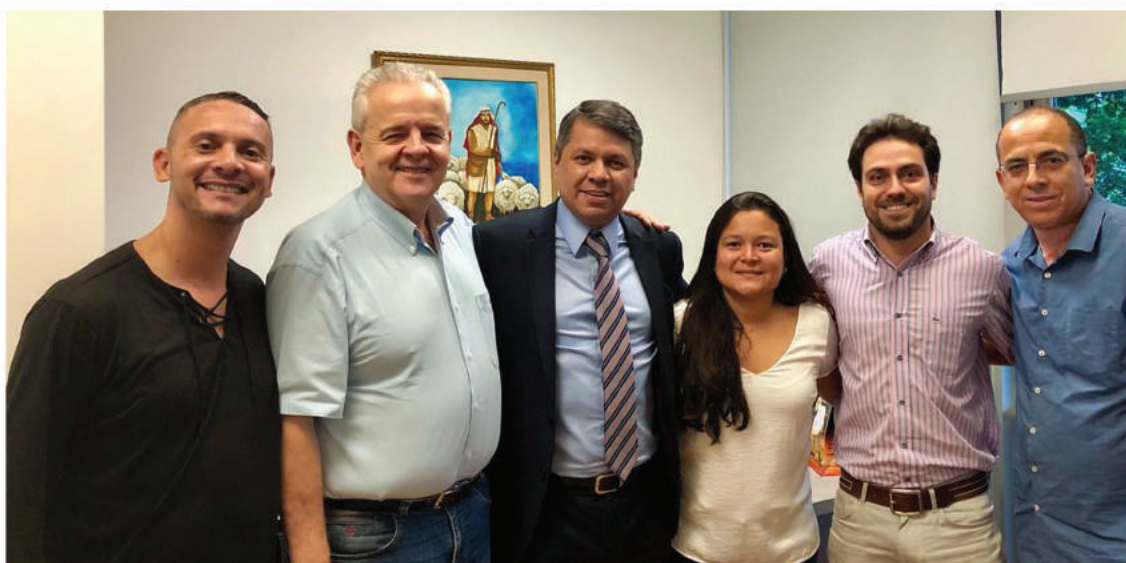
Diretoria da Federação de Surdos de Minas Gerais